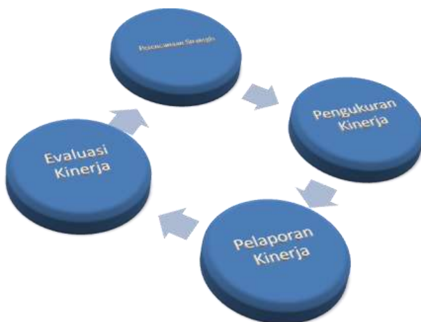
Gambar I Siklus Akuntabilitas Kinerja Instansi Pemerintah

Sistem Akuntabilitas Kinerja Instansi Pemerintah (SAKIP) membentuk siklus tak terputus dari tahapan utama manajemen strategis sektor publik sebagai berikut :