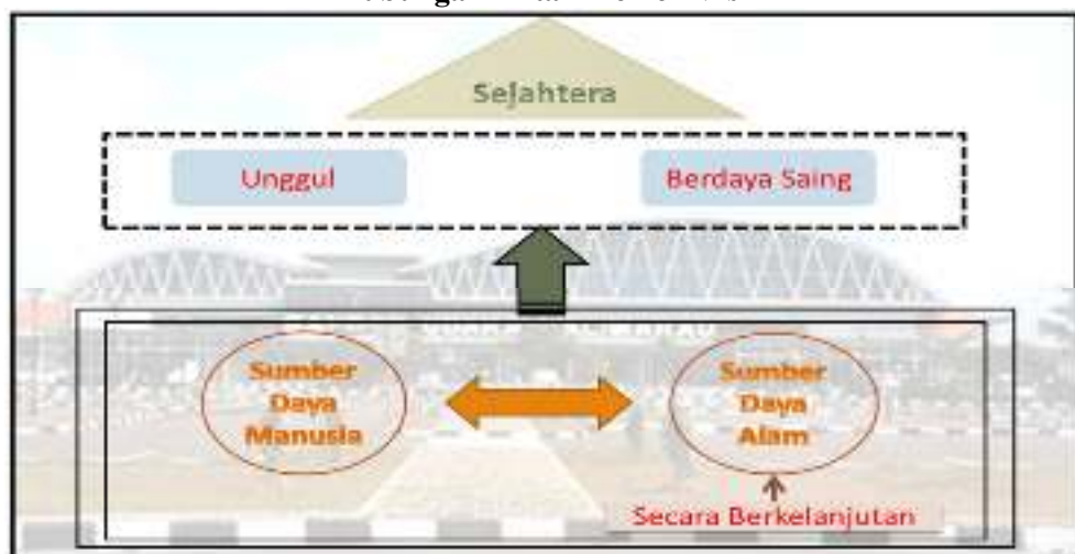
Gambar 2.2.1 Hubungan Antar Elemen Visi

Kabupaten Berau merupakan salah satu pintu gerbang pembangunan di wilayah Provinsi Kalimantan Timur yang terletak di sebelah utara dan berbatasan langsung dengan Provinsi Kalimantan Utara. Sebagai daerah yang memiliki keindahan wilayah daratan, pesisir pantai, dan lautan dengan sumber daya alam yang beraneka ragam, visi tersebut sangatlah tepat, dimana peningkatan kesejahteraan masyarakat Kabupaten Berau dilandaskan pada keberhasilan pengembangan sumber daya manusianya dengan tetap ditopang oleh pemanfaatan sumber daya alam secara berkelanjutan. Hubungan antar elemen visi di atas dapat digambarkan sebagai berikut: