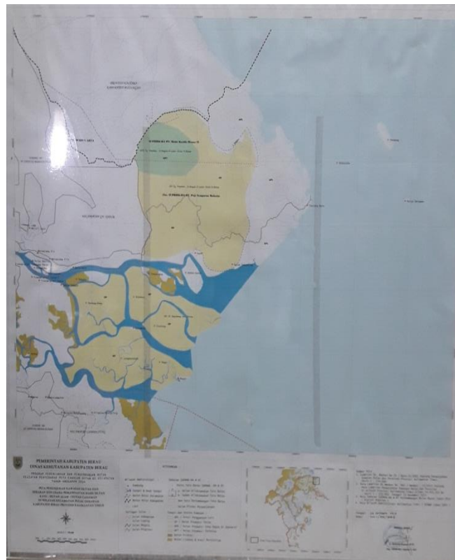
Gambar 1.1 : Peta Kecamatan Pulau Derawan

Penjelasan-penjelasan tersebut diatas, sebagaimana ditunjukkan dalam peta wilayah Kecamatan Pulau Derawan Kabupaten Berau sebagai berikut.