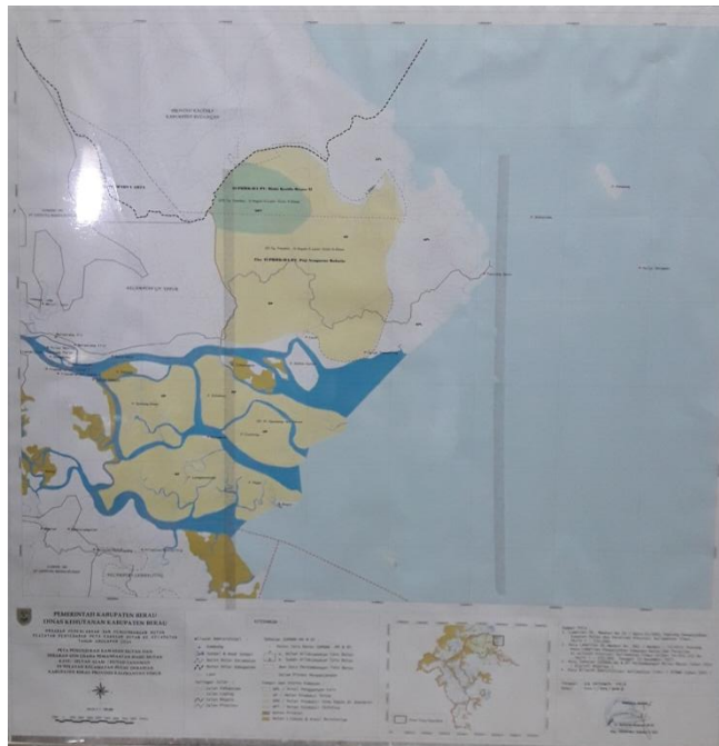
Gambar 2.1 PETA KECAMATAN PULAU DERAWAN

Potensi sumber daya alam yang dimiliki oleh Kecamatan Pulau Derawan dari aspek demografi penduduk Kecamatan Pulau Derawan berjumlah ± 11.298 jiwa, terdiri dari Laki – laki berjumlah 5.906 jiwa dan Perempuan berjumlah 5.392 jiwa. Fasilitas umum untuk pelayanan kepada masyarakat yang berada di wilayah Kecamatan Pulau Derawan terdiri dari Puskesmas sebanyak 2 (dua) buah yang berlokasi di Tanjung Batu dan Pulau Derawan. Kecamatan Pulau Derawan terdiri dari 5 (lima) kampung yaitu pulau derawan, tanjung batu, kasai, teluk semanting dan pegat batumbuk. Untuk kampung Pulau Derawan dan Pegat batumbuk hanya bisa ditempuh melalui transportasi laut, sedangkan untuk kampung tanjung batu, kasai dan teluk semanting bisa ditempuh melalui transportasi darat dan laut.